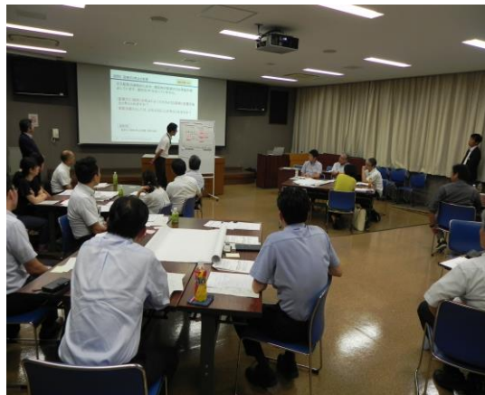
昨年のワークショップの様子